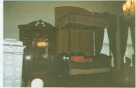
"Cumhuriyet Bayramı ve Atatürk" anısına Dolmabahçe Sarayı'na gezi yaptık. Sarayda Osmanlı Padişahlarının ve Cumhuriyetimizin kurucusu büyük önder Atatürk'ün yaşadığı yerleri gördük. Tarihimize hakkında bilgi edindik.