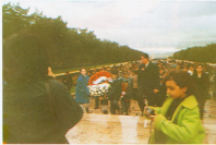
13-14 Kasım 1998 tarihinde ilköğretim 4-5 ve 6. Sınıflar Ankara gezisine katıldılar. Gezi boyunca bakanlık görevlendirilen rehberler eşliğinde; Anıtkabir' de Devlet Tiyatrosu yapılarak Atatürk'e çelenk konuldu. Atatürk ve İsmi'nin kabirleri ziyaret edilerek Anıtkabir bölümleri gezildi. 2. Meclis Binası, Anadolu Medeniyetleri Müzesi, Pembe Kışık ve Atatürk Orman Çiftliği'nde "Atatürk Evi" gezildi.