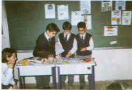
5. sınıflar P.Y.P. sistemine göre, dersi öğrencilerin aktif olarak işlenmesi, Sınıf içi hazırlanmalar, Ders işlenirken "sınıf istasyonlarında" yapılan çalışmalarından kesitler. ÜNİTE: Canlılar Dünyası-Hayvanlar