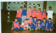
Okulumuz Hentbol Takımı