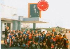
Our Handball Team

Okulumuz 2/A ve 2/B sınıfları İstanbul TRT Televizyonunu ziyaret ettiler. Bu ziyaretle canlı yayının nasıl yapıldığına yakından ilenme fırsatına gördüler.