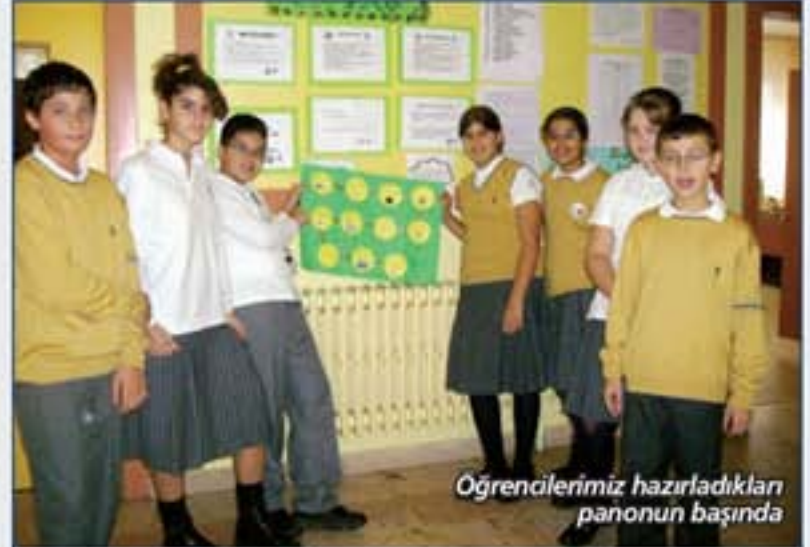
Öğrencilerimiz hazırladıkları panonun başında

Çevre&Doğa ve Young Reporters Kulübü olarak öncelikle öğrencilerin çevre bilincini geliştirecek çalışmalara yer verildi. Yapılan çalışmalar panolarda sergilenerek tüm okul toplumu ile paylaşılıyor. Kulüp öğrencileri ve farklı sınıflardan seçilen gönüllü öğrenciler okulumuzda bir Eco-Team oluşturdu ve bu yılın teması olarak seçilen "Enerji" konusunda çalışmalar yapmaya devam ediyorlar.