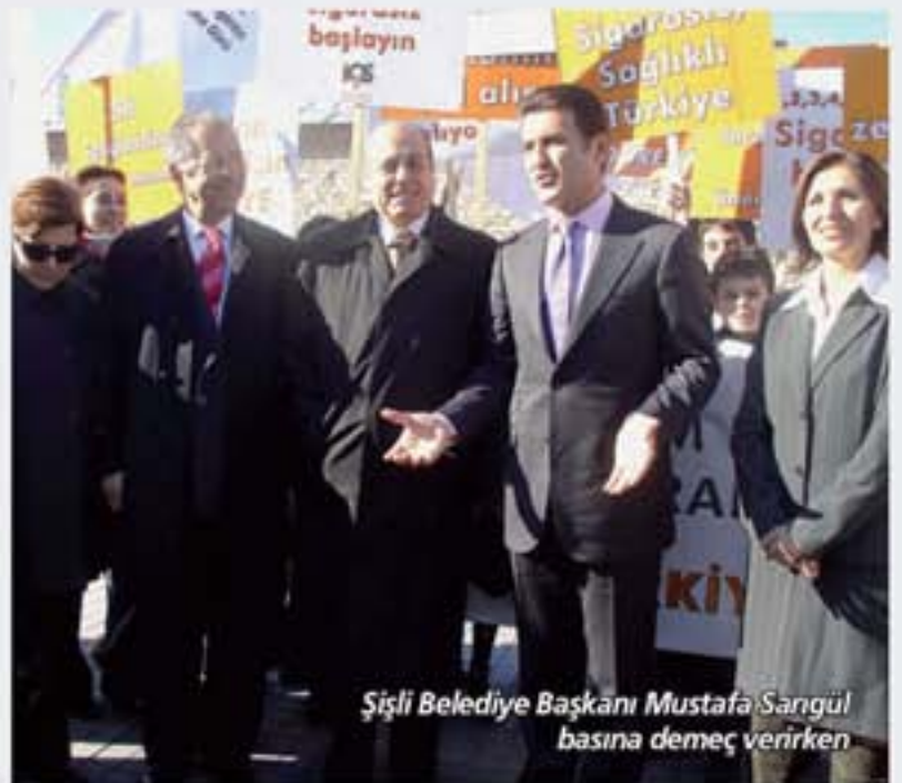
Şişli Belediye Başkanı Mustafa Sarıgül basınla görüşüyor