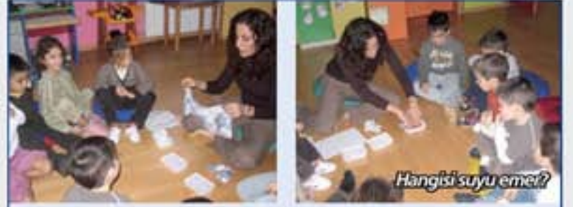
Hangisi suyu emer?