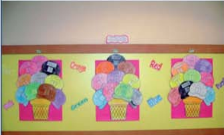
Kaç renk görüyorsun?