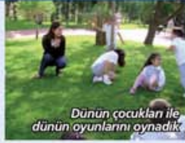
Dünün çocukları ile dünün oyunlarını oynadık