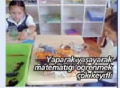
Yaparak yaşayarak matematiği öğrenmek çok keyifli