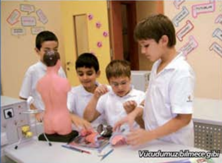
Vücudumuz bilmece gibi