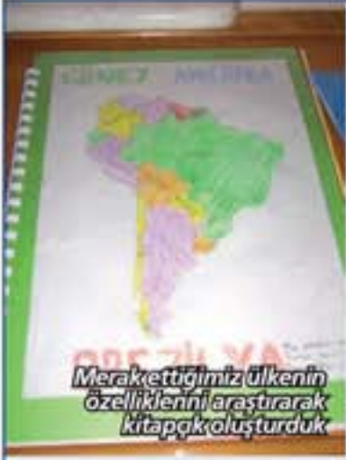
Merak ettiğimiz ülkenin özelliklerini araştırarak kitapçık oluşturduk