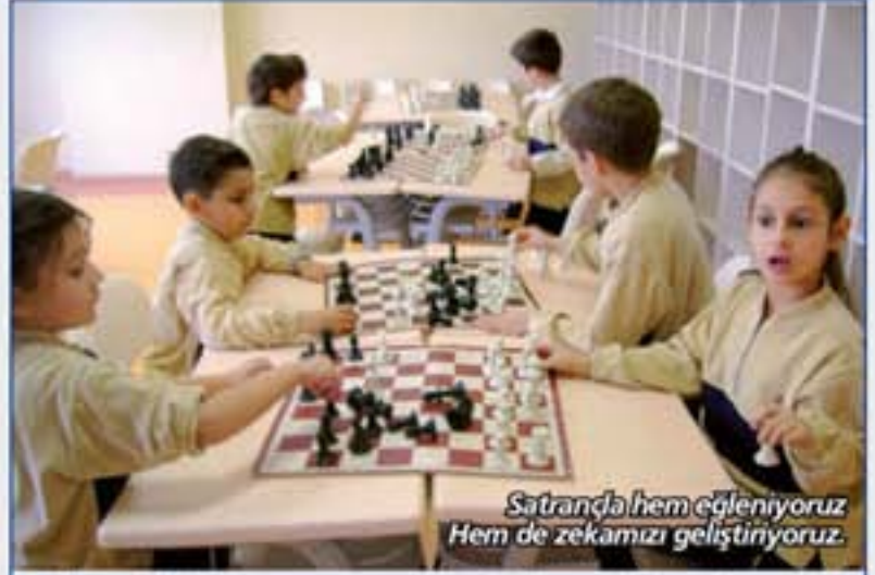
Satrançla hem eğleniyoruz Hem de zekamızı geliştiriyoruz.