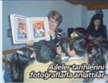
Aileler tarihlerini fotoğraflarla anlattılar