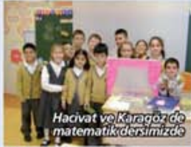
Hacivat ve Karagöz'de matematik dersimizde