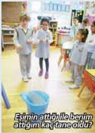
Eşimin attığı ile benim attığım kaç tane oldu?