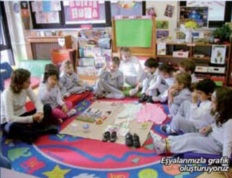
Eşyalarımızla grafik oluşturuyoruz