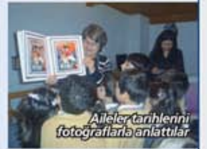
Aileler tarihlerini fotoğraflarla anlattılar