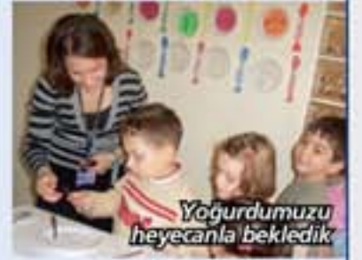
Yoğurdumuzu heyecanla bekledik