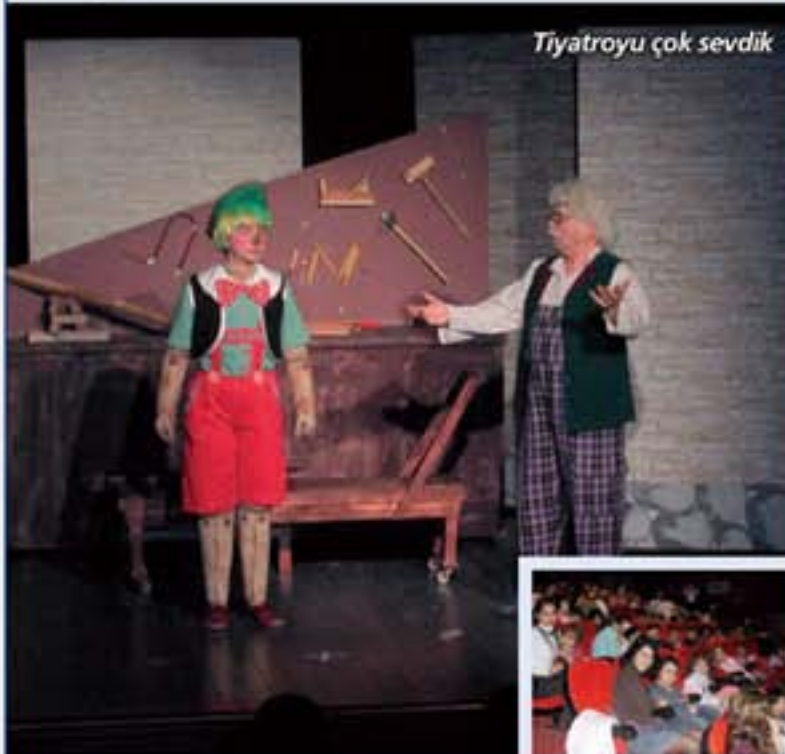
Tiyatroyu çok sevdi