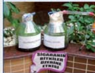
SIGARANIN BİYİKLER ÜZERİNE ETKİSİ