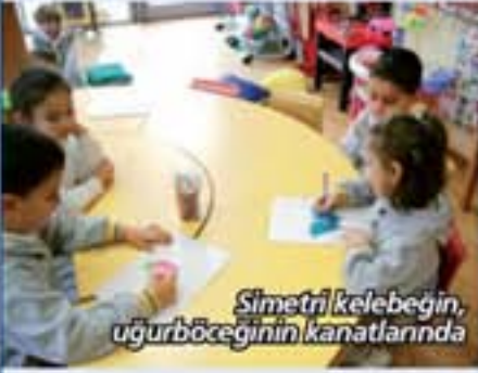
Simetri kelebeğin, uğurböceğinin kanatlarında