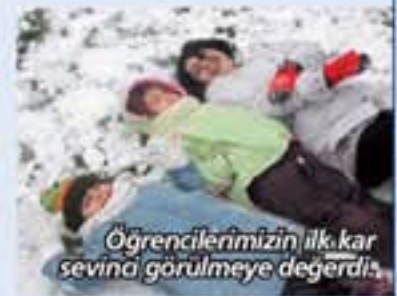
Öğrencilerimizin ilk kar sevinine görülmeye değerdir