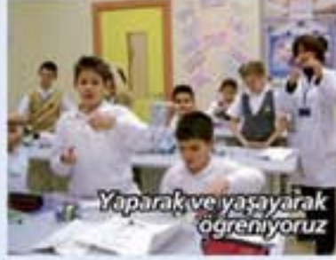
Yaparak ve yaşayarak öğreniyoruz