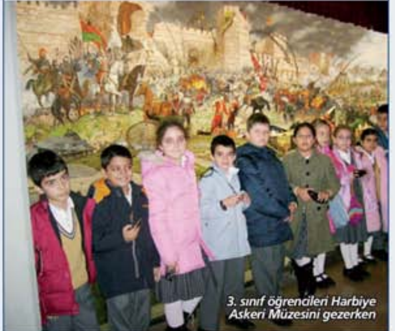
3. sınıf öğrencileri Harbiye Askeri Müzesini gezerken