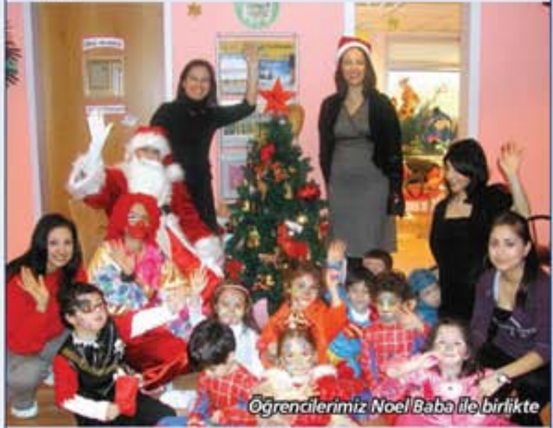
Öğrencilerimiz Noel Baba ile birlikte