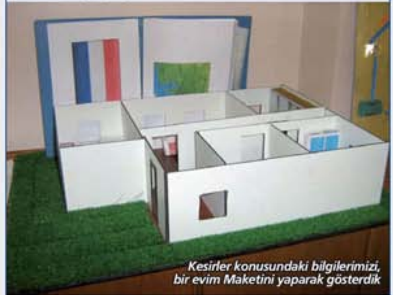
Kesirler konusundaki bilgilerimizi, bir evim Maketini yaparak gösterdik