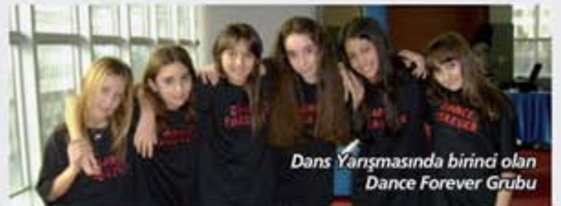
Dans Yarışmasında birinci olan Dance Forever Grubu

Eyüboğlu Öğrenci Birliği 6., 7., 8., Lise Hz. ve 9. sınıflardaki öğrenciler için 26 Aralık 2006 tarihinde Yeni Yıl Partisi düzenledi. Parti dans yarışması, okul orkestrasının canlı performansı ve hediye çekilişiyle oldukça renkli geçti. Dans yarışmasında 7. sınıf öğrencilerimizden oluşan "Dance Forever" grubu birinci oldu. Partinin sonunda yeni yıl pastası kesildi.