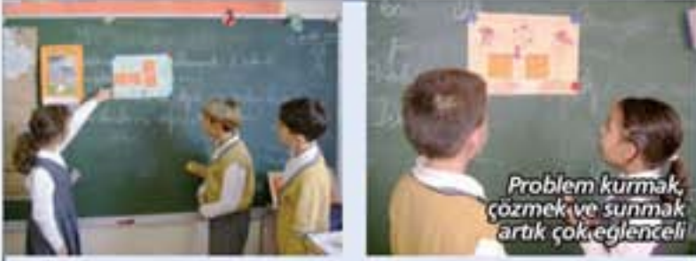
Problem kurmak, çözmek ve sunmak artık çok eğlenceli