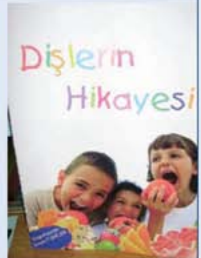
Diş doktoruyla yaptığımız röportaj sonrasında dişlerimizin sağlığı hakkında bilgiler edindik