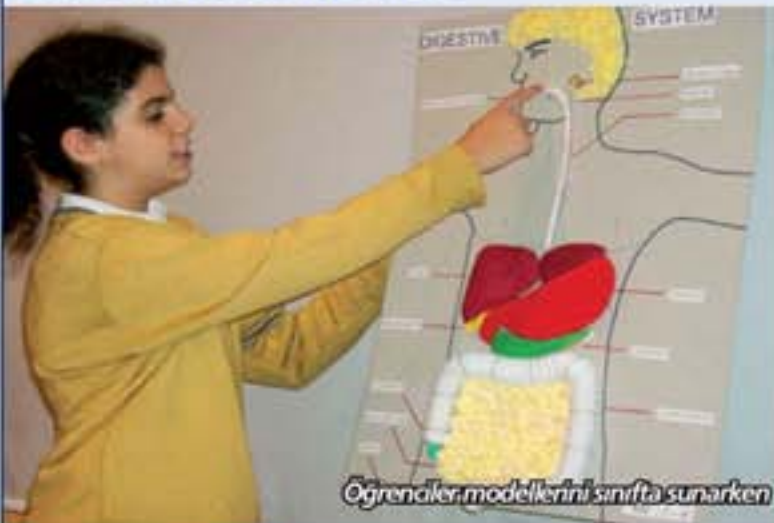
Öğrenciler modellerini sınıfta sunarken

7. sınıf öğrencilerimiz sindirim sistemi konusunun görsel olarak daha iyi anlaşılmasına yönelik bir model çalışması yaptılar. Seçilen çalışmalar 7. sınıflar katında sergileniyor.