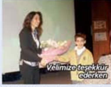
Velimize teşekkür ederken