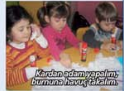
Kardan adam yapalım, burmuna havuç takalım.