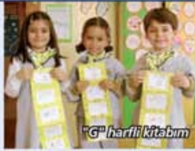
"G" harfli kitabım