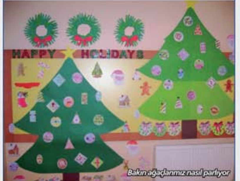
Bakın ağaçlarımız nasıl parlıyor