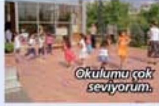
Okulumu çok seviyorum.