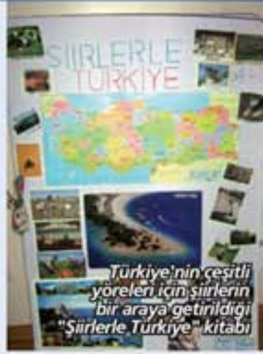
Türkiye'nin çeşitli yöreleri için şiirlerin bir araya getirildiği "Şiirlerle Türkiye" kitabı