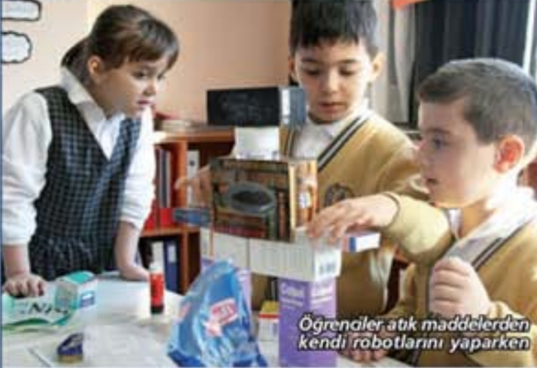
Öğrenciler atık maddelerden kendi robotlarını yaparken