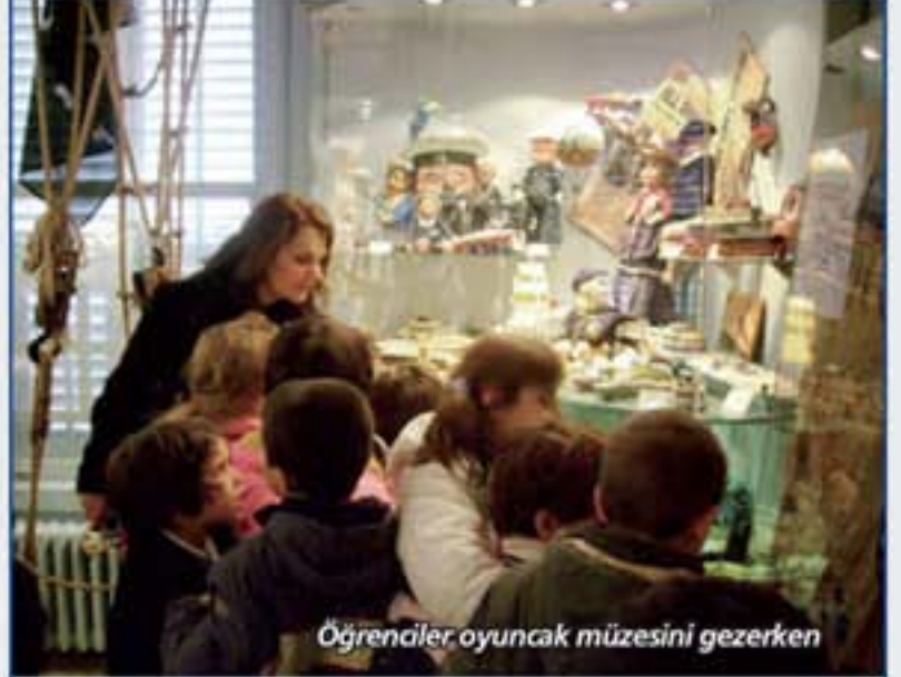
Öğrenciler oyuncak müzesini gezerken