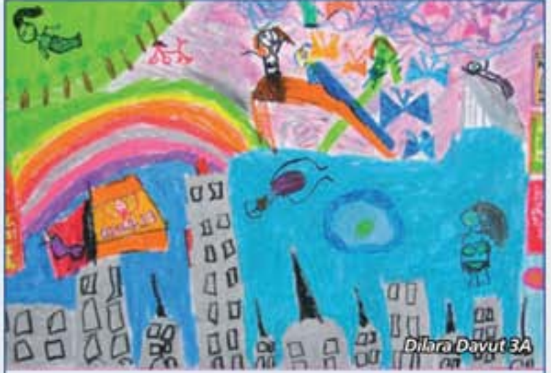
Dilara Davut 3A