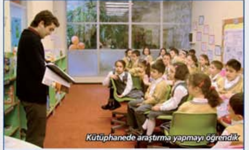
Kütüphanede araştırma yapmayı öğrendik

Besin çeşitlerini ve yararlarını araştıran öğrencilerimiz araştırma sonuçlarını sınıf arkadaşlarına sundular.