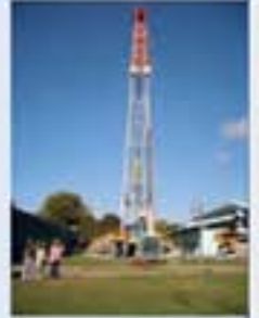
Enerji Parkı görülmeye değerdi