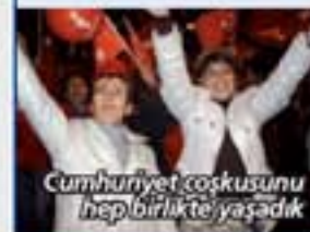
Cumhuriyet coşkusunu hep birlikte yaşadık