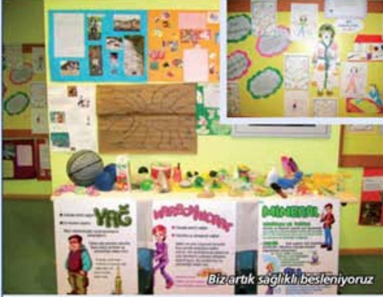
Biz artık sağlıklı besleniyoruz