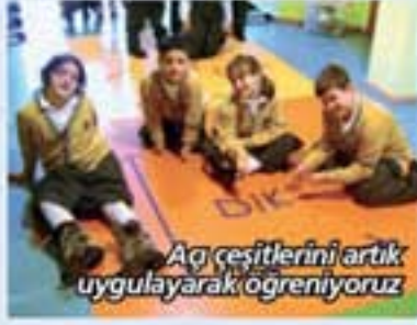
Açı çeşitlerini artık uygulayarak öğreniyoruz