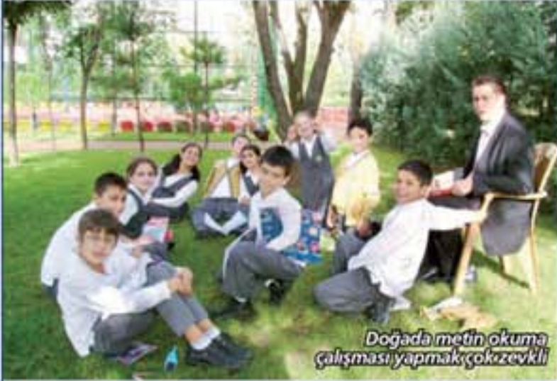
Doğada metin okuma çalışması yapmak çok zevkli