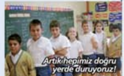
Artık hepimiz doğru yerde duruyoruz!