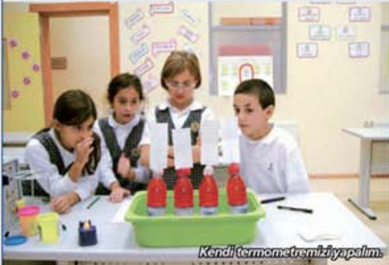
Kendi termometremizi yapalım.

Araştırma becerilerini geliştirmek, bilimsel düşünme yeteneğini arttırmak ve geleceğin aydın, başarılı ve yaratıcı bilim insanları olmak için şimdiden büyük bir özveri ile çalışan öğrencilerimiz, projeler üreterek bu projelerini hayata geçirdiler.