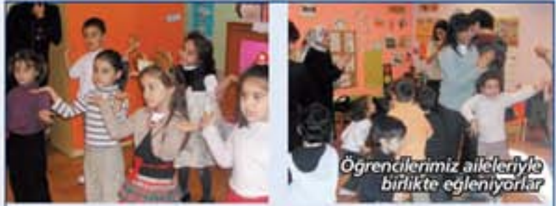
Öğrencilerimiz aileleriyle birlikte eğleniyorlar