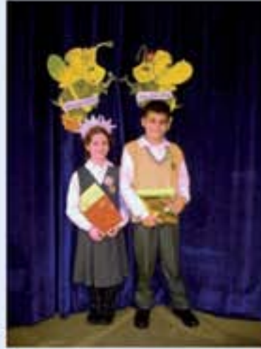
Birinci dönemin SPELLING BEE kraliçesi ve kraliçesini seçtik