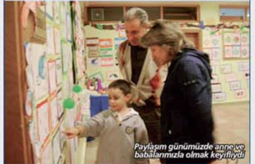
Paylaşım günümüzde anne ve babalarımızla olmak keyifliydi