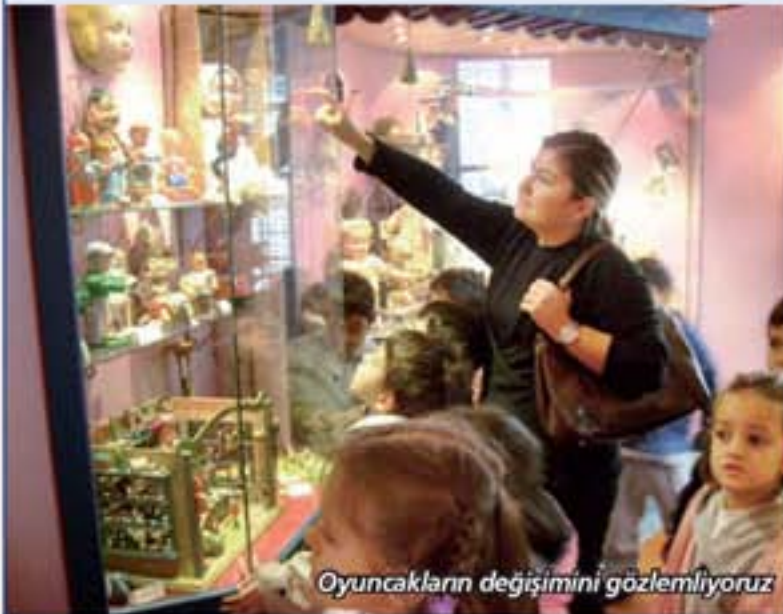
Oyuncakların değişimini gözlemliyoruz