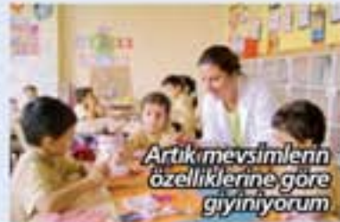
Artık mevsimlerin özelliklerine göre giyiniyorum