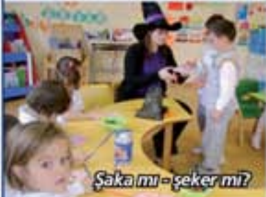
Şaka mı - şeker mi?