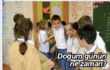
Doğum günün ne zaman?