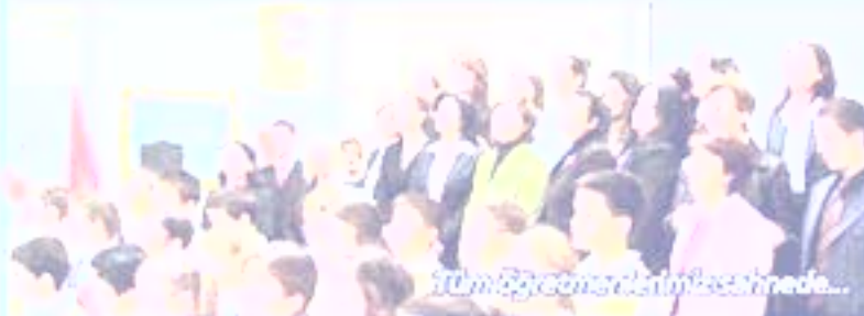
10. Yılı Kutlamaları Sahnede...