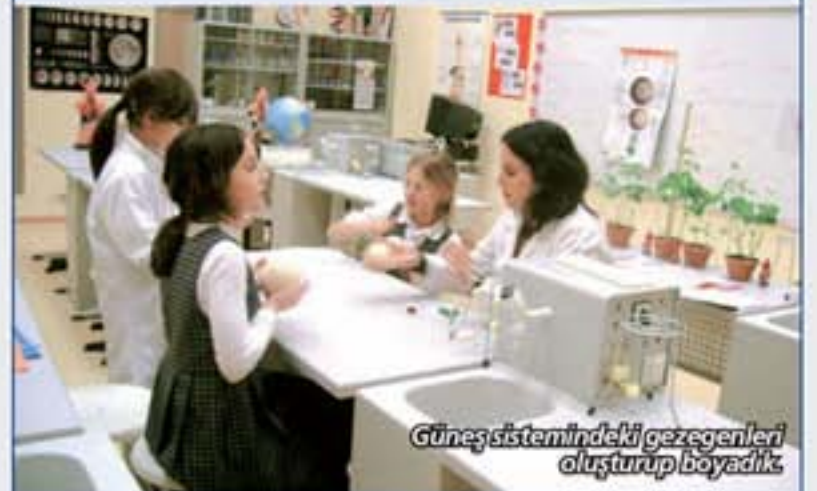
Güneş sistemindeki gezegenleri oluşturup boyadık.