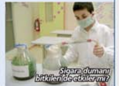
Şişirici dumanı bitkileri de etkiler mi?

Bilimsel düşünme becerilerimizi sergilemek amacıyla öğrencilerimiz projeler oluşturup yarışmalara hazırlanıyorlar.