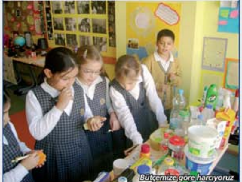
Bütçemize göre harcıyoruz