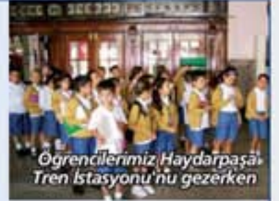
Öğrencilerimiz Haydarpaşa Tren İstasyonu'nu gezerken

• İkinci sınıf öğrencilerimiz; trenler, tren yolculuğu ve trenlerin çalışması ile ilgili bilgi edinmek üzere Haydarpaşa Tren İstasyonu'na gezi düzenlediler. Kondüktör ve gar memurlarıyla söyleşi yaptılar.