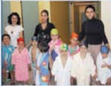
Öğrencilerimiz yüzme dersinde