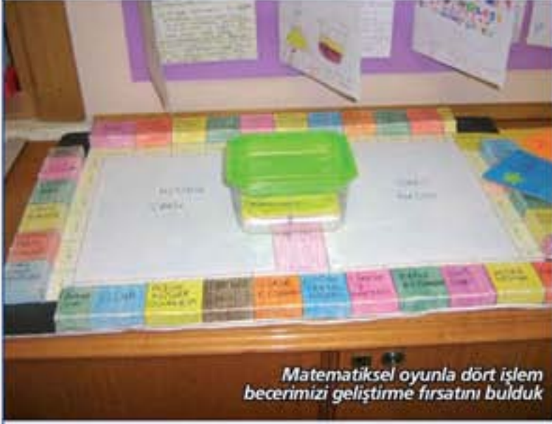
Matematiksel oyunla dört işlem becerimizi geliştirme fırsatını bulduk