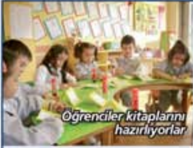
Öğrenciler kitaplarını hazırlıyorlar