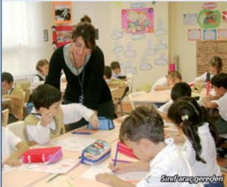
Sınıf araç gereçleri