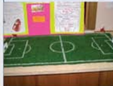
Bir futbol sahasını tasarlayarak, matematik dersinde öğrendiğimiz bilgileri günlük hayatımıza uyguladık