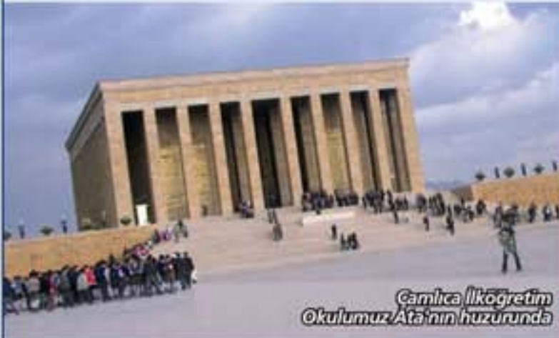
Çamlıca İlköğretim Okulumuz Ata'nın huzurunda