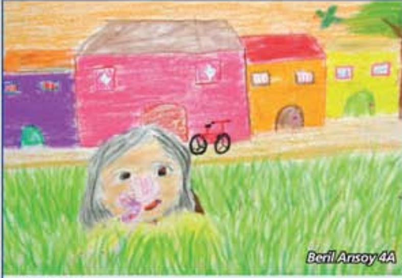
Beril Arsoy 4A