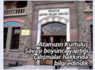
Atamızın Kurtuluş Savaşı boyunca yaptığı çalışmalar hakkında bilgi edindik

Aynı zamanda, Atatürk ile Türk milletinin Kurtuluş Savaşı sırasında verdiği mücadeleyi ve Türk milletinin kültürel değerlerini yerinde görme, inceleme ve öğrenme imkanını elde ettik.