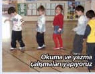
Okuma ve yazma çalışmalarını yapıyoruz