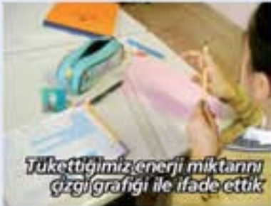
Tükettiğimiz enerji miktarını çizgi grafiği ile ifade ettik