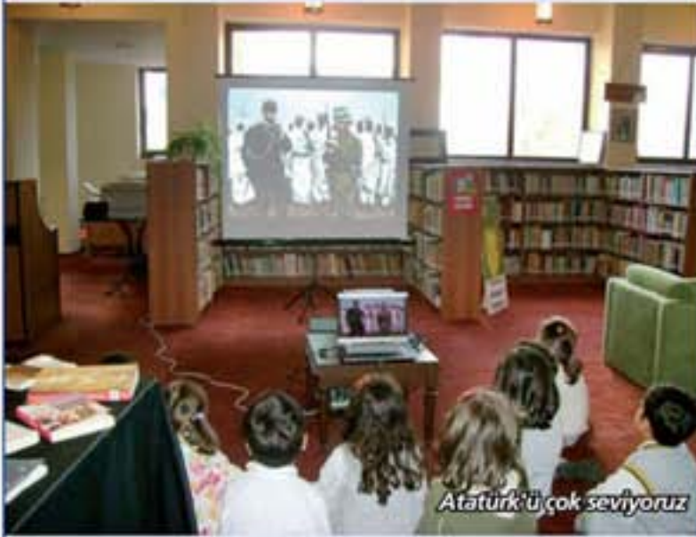
Atatürk'ü çok seviyoruz