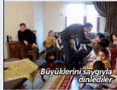
Büyüklerini saygıyla dinlediler