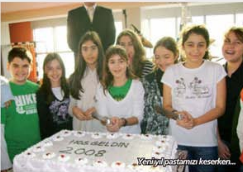
Yeni yıl pastamızı keserken...