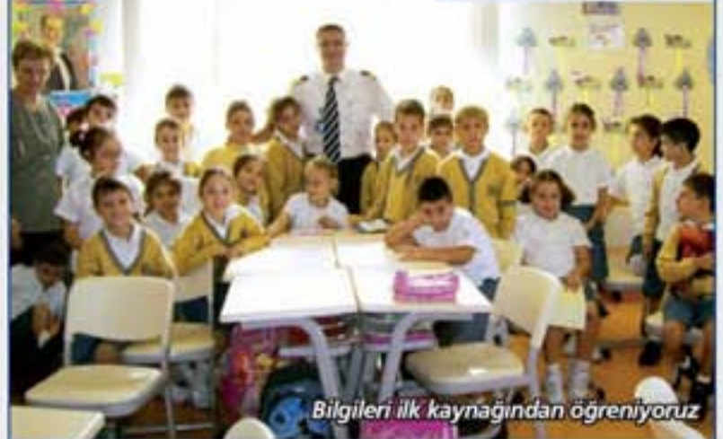
Bilgileri ilk kaynağından öğreniyoruz