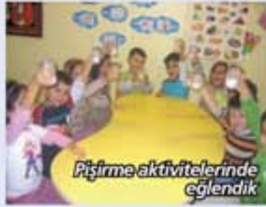
Pişirme aktivitelerinde eğlendik