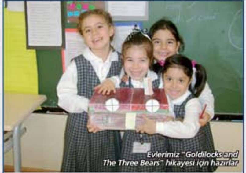
Evlerimiz "Goldilocks and The Three Bears" hikayesi için hazır!