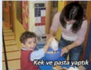
Kek ve pasta yaptık