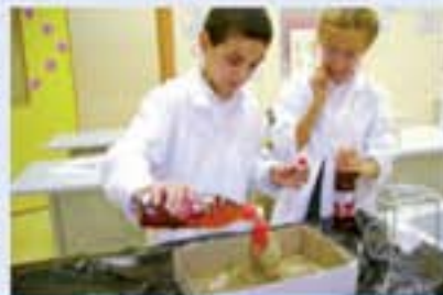
Yanardağlar nasıl lavpüskürtür?

Araştırma becerilerini geliştirmek, bilimsel düşünme yeteneğini arttırmak ve geleceğin aydın, başarılı ve yaratıcı bilim insanları olmak için şimdiden büyük bir özveri ile çalışan öğrencilerimiz, projeler üreterek bu projelerini hayata geçirdiler.