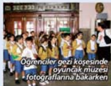
Öğrenciler gezi köşesinde oyuncak müzesi fotoğraflarına bakarken