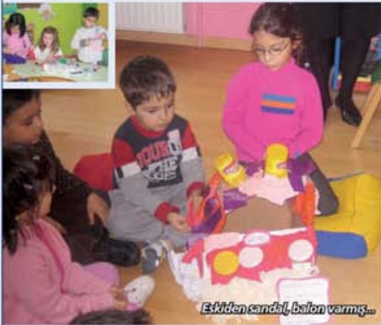
Eskiden sandal, balon varmış...