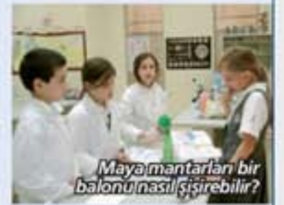
Maya mantarları bir balonu nasıl şişirebilir?