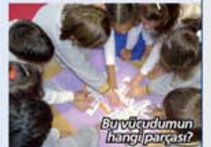
Bu vücudumun hangi parçası?