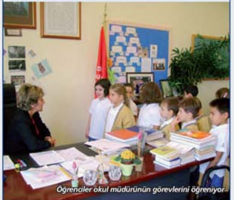
Öğrenciler okul müdürünün görevlerini öğreniyor