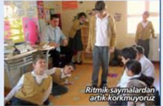
Ritmik saymalardan artık korkmuyoruz