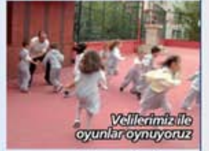
Velilerimiz ile oyunlar oynuyoruz