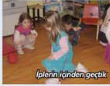
İplerin içinden geçtik