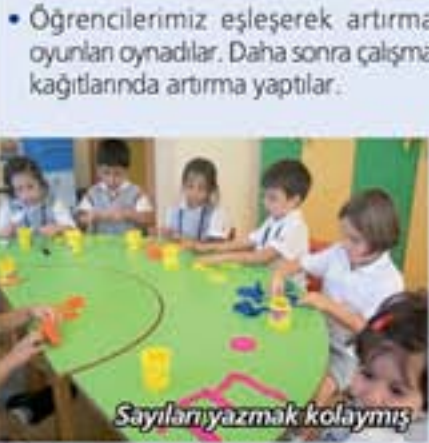
Sayıları yazmak kolaymış