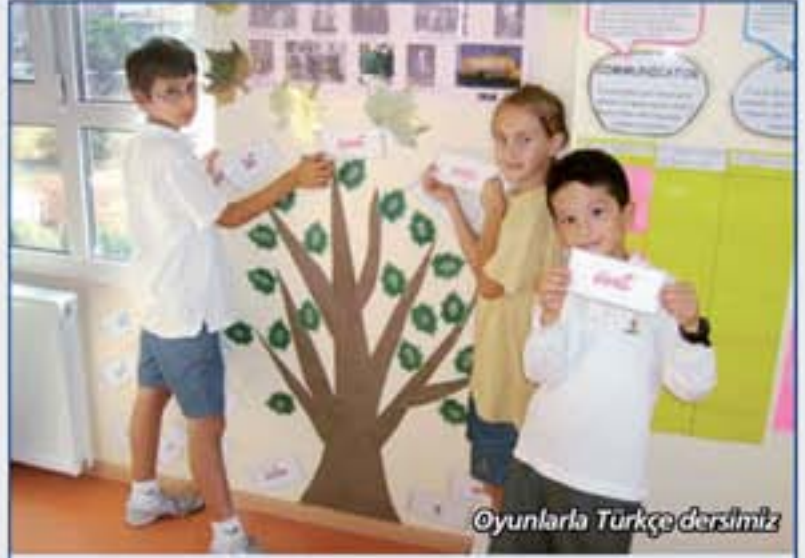
Oyunlarla Türkçe dersimiz