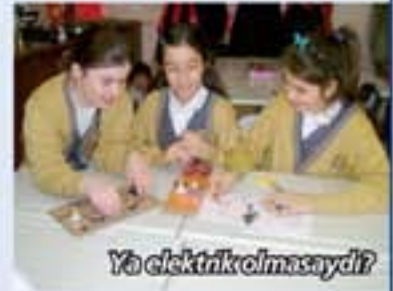
Ya elektrik olmasaydı?