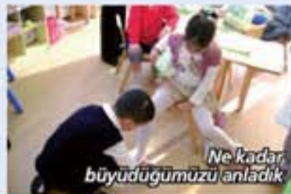
Ne kadar büyüdüğümüzü anladık