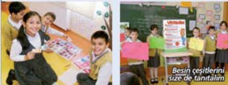
Besin çeşitlerini size de tanıtalım

Besin çeşitlerini ve yararlarını araştıran öğrencilerimiz araştırma sonuçlarını sınıf arkadaşlarına sundular.