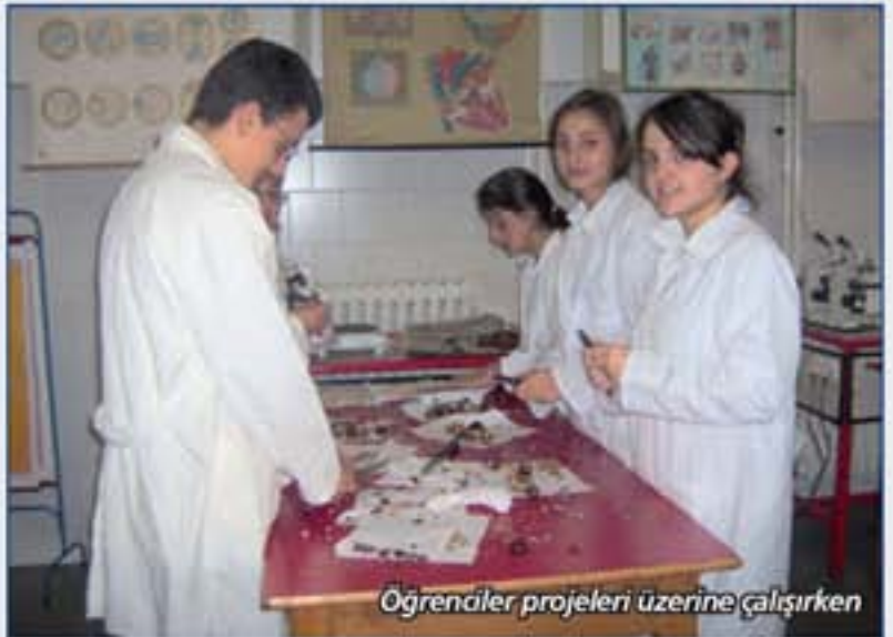
Öğrenciler projeleri üzerine çalışırken

Volvo Adventure Kulübü'nün amacı; yarının karar vericileri olan gençleri uygulanabilir yerel çevre projelerini ele alma konusunda cesaretlendirmek ve çevre konusundaki farkındalığı artırmaktır. Bu bağlamda "Chemical Cleansers don't have innocence-Kimyasal Temizleyiciler Masum Değildir!" adlı proje ile Volvo Adventure Proje yarışmalarında okulumuz temsil edilecek.