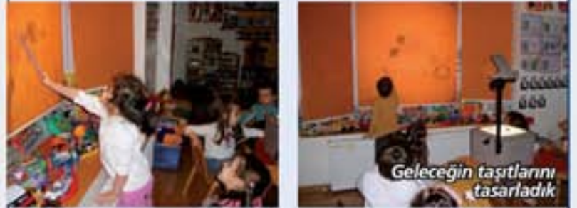
Geleceğin taşıtlarını tasarladık