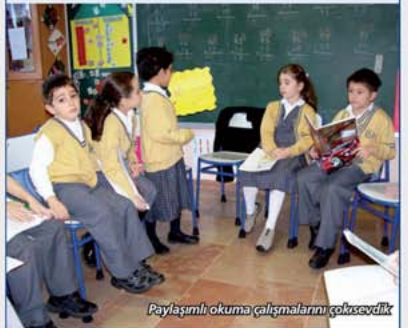
Paylaşımli okuma çalışmalarını çokisevdik