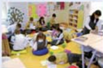
Araştıran ve sorgulayan öğrencileriz