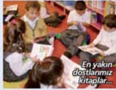
En yakın dostlarımız kitaplar...