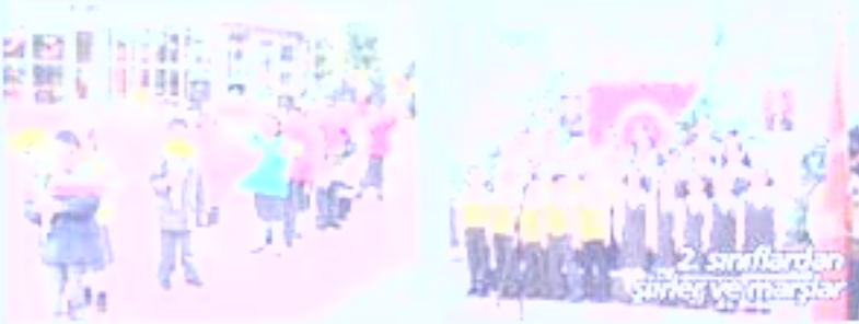
2. sınıflardan şarkılar ve marşlar