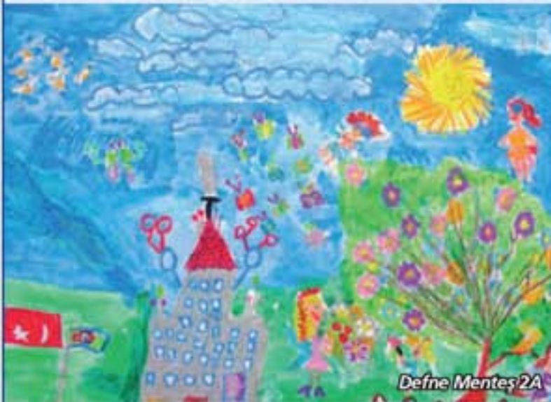
Defne Menteş 2A