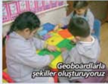
Geoboardlarla şekiller oluşturuyoruz