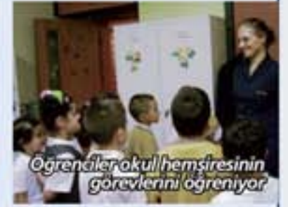
Öğrenciler okul hemşiresinin görevlerini öğreniyor