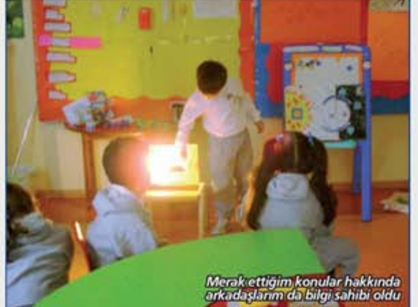
Merak ettiğim konular hakkında arkadaşlarımda bilgi sahibi oldum