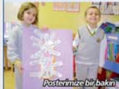
Posterimize bir bakın