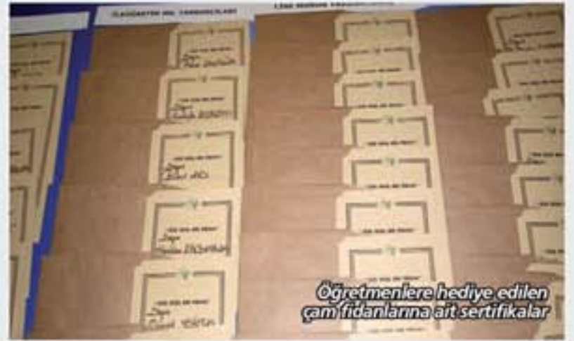
Öğretmenlere hediye edilen çam fidanlarına ait sertifikalar