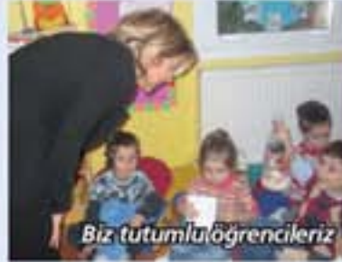
Biz tutumlu öğrencileriz