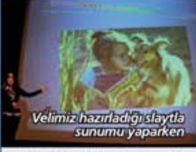
Velimiz hazırladığı slaytla sunumu yaparken