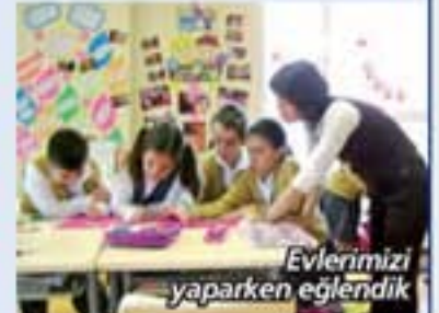
Evlerimizi yaparken eğlendik