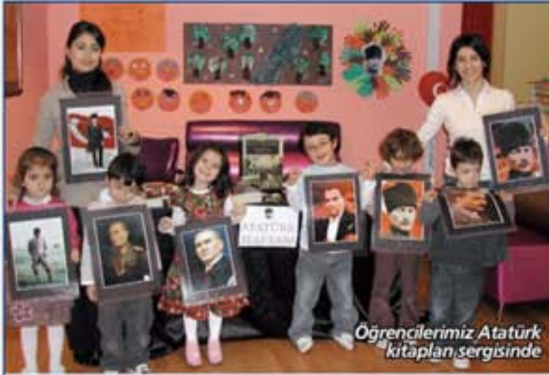
Öğrencilerimiz Atatürk kitapları sergisinde