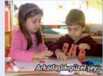
Arkadaşlık güzel şey