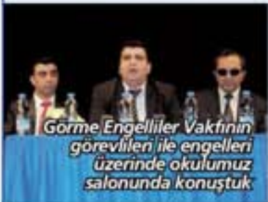
Görme Engelliler Vakfının görevlileri ile engelleri üzerinde okulumuz salonunda konuştuk