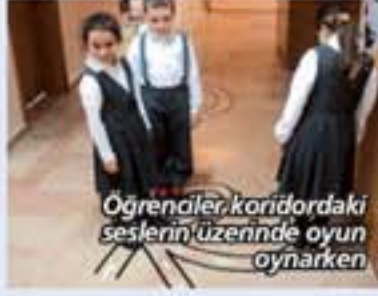
Öğrenciler koridordaki seslerin üzerinde oyun oynarken