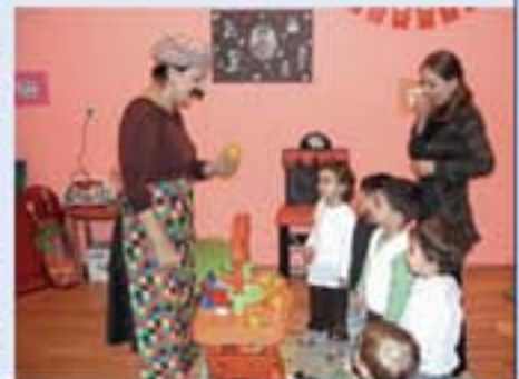
Manavdan alışveriş yapıyoruz