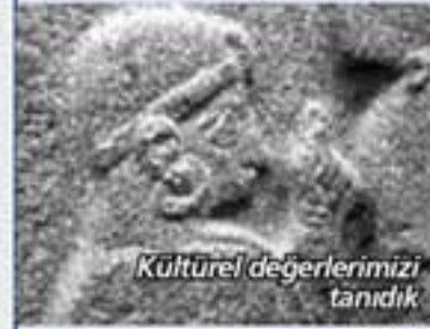
Kültürel değerlerimizi tanıdık