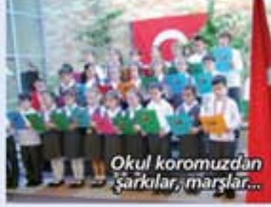
Okul korumuzdan şarkılar, marşlar...