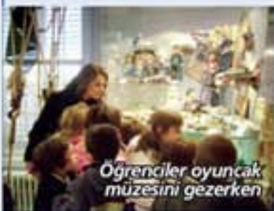
Öğrenciler oyuncak müzesini gezerken