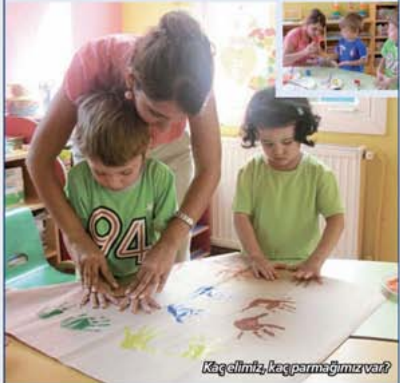
Kaç elimiz, kaç parmağımız var?