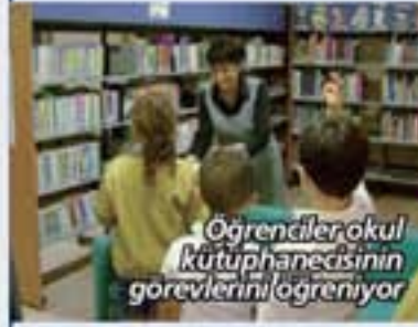
Öğrenciler okul kütüphanecisinin görevlerini öğreniyor