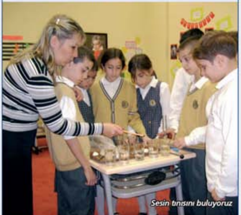
Sesin tınısını buluyoruz

• 4. sınıf öğrencilerimiz sesin tını özelliklerini deneyerek öğrendiler.