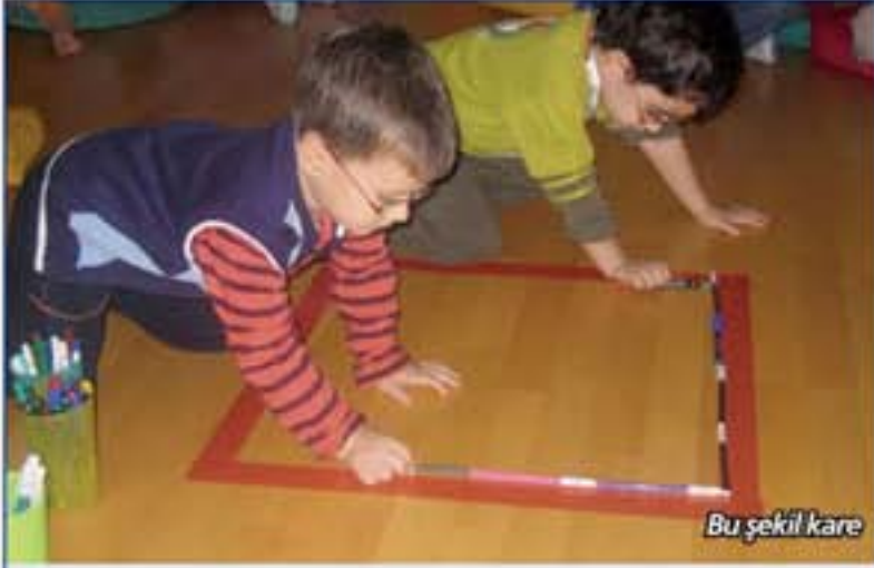
Bu şekil kare