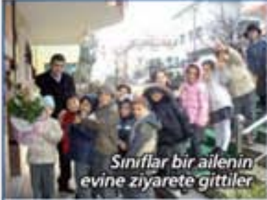
Sınıflar bir ailenin evine ziyarete gittiler