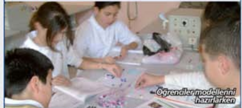
Öğrenciler modellerini hazırlarken

6. sınıf öğrencilerimiz Fen ve Teknoloji derslerinde; atom, molekül, bileşik ve karışım kavramlarını boncuklarla modellediler ve sınıflarında arkadaşlarıyla paylaştılar. Yapılan çalışmalar 6. sınıf laboratuvarında sergileniyor.