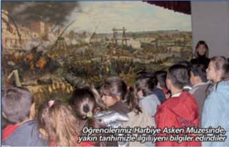
Oğrencilerimiz Harbiye Askeri Müzesinde, yakın tarihimize ilgili yeni bilgiler edindiler