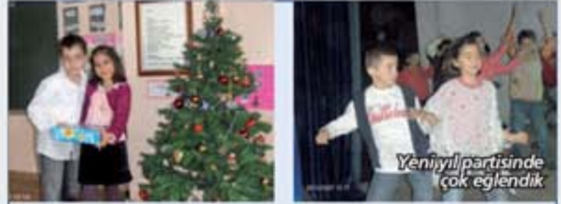
Yeni yıl partisinde çok eğlendik