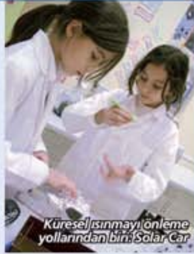
Küresel ısınmayı önleme yollarından biri: Solar Car