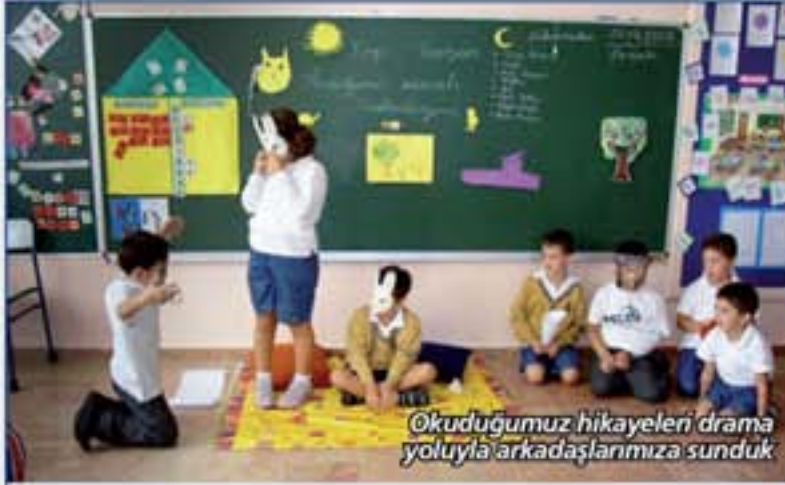
Okuduğumuz hikayeleri drama yoluyla arkadaşlarımıza sunduk