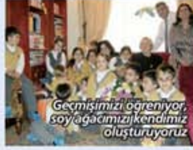
Geçmişimizi öğreniyor, soy ağacımızı kendimiz oluşturuyoruz