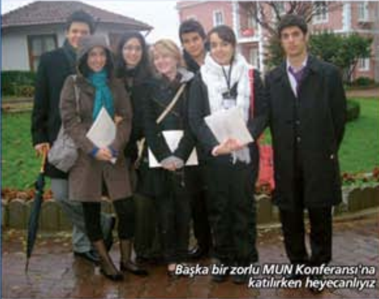
Başka bir zorlu MUN Konferansı'na katılırken heyecanlıyız

6-9 Aralık 2007 tarihlerinde Üsküdar Amerikan Lisesi'nde düzenlenen Uluslararası Birleşmiş Milletler Modeli Konferansı'na katıldık. Birleşmiş Milletler Kulübü'nden 8 öğrencimiz ile katıldığımız Konferansta Mısır Delegasyonunu temsil ettik. Konferansta; silahsızlanma, insan hakları, bölgesel anlaşmazlıklar, çevre, ekonomik sosyal, legal ve eşitlik konulu özel konferans komitelerinde ülkeler arası çatışmaya yol açabilen değerli mineraller, nükleer silahların tümüyle yok edilmesine yönelik kararlı tutum, Guantanamo Koyu'nda gözaltındaki mahkumların durumu, 21. yüzyıl toplumlarında özürülüler için World Programme of Action çalışmasının uygulanması, Abhazya sınırları ve bölgedeki mültecilerin yaşam koşulları, küresel ısınmayı azaltmada etkin planlama, terör nedeniyle gözaltına alınan şüphelilerin yasal durumları, ırkçılığın ortadan kaldırılması ve yoksulluğu yok etmede micro kredi uygulamasının yaygınlaştırılması gibi global sorunlar için çözüm önerileri hazırlandı.