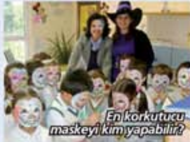
En korkutucu maskeyi kim yapabilir?