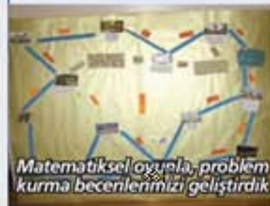
Matematiksel oyunla, problem kurma becerilerimizi geliştirdik