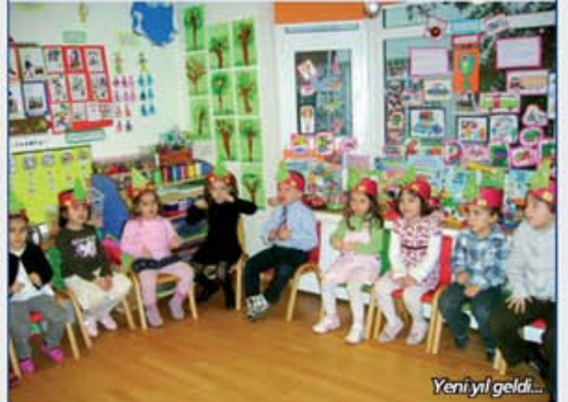
Yeni yıl geldi...