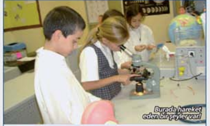
Burada hareket eden bir şeyler var!