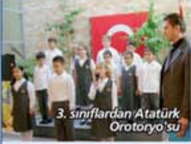
3. sınıflardan Atatürk Orotoryo'su