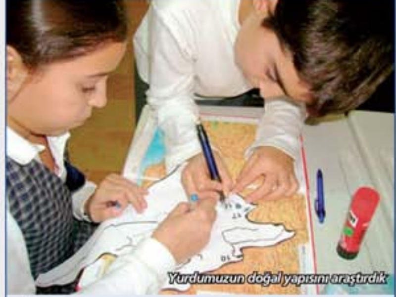
Yurdumuzun doğal yapısını araştırdık