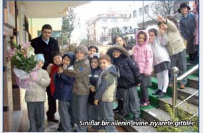
Sınıflar bir ailenin evine ziyarete gittiler