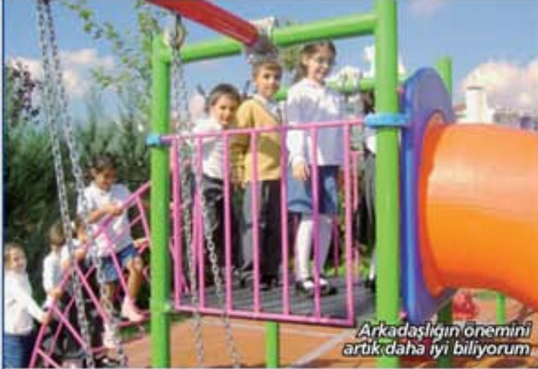
Arkadaşlığın önemini artık daha iyi biliyorum