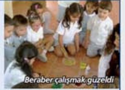
Berber çalışmak güzeldi