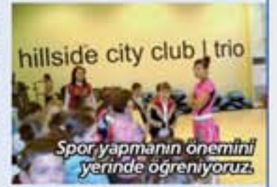
Spor yapmanın önemini yerinde öğreniyoruz.

• İkinci sınıf öğrencilerimiz Hillside Spor Merkezi'ne gittiler ve sağlıklı olmak için sporun hayatımızdaki önemini görevli kişilerle söyleşi yaparak bir kez daha öğrendiler. Yapmaları gereken spor aktiviteleri hakkında bilgiler edindiler.