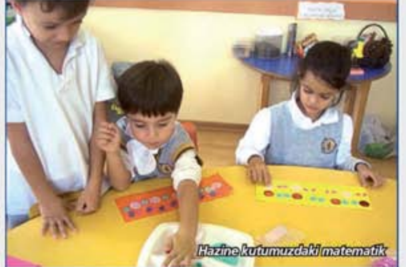
Hazine kutumuzdaki matematik